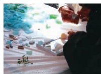
シークラスアート作り