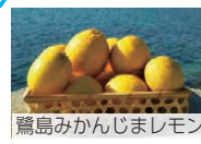
広島みかんじまレモン