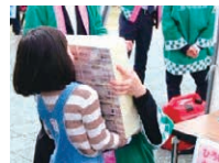
キッズマネースクール

子どもたちが楽しめる遊び・学びのブースや大人も足を止める展示など、いろいろな体験が盛りだくさんの広場です。